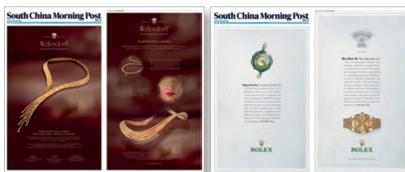
2版/4版铜版纸/道林纸封套